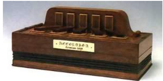
Accordion de Demian

C'est le 6 mai 1829, à Vienne, que le facteur d'orgues et de pianos Cyril Demian et ses fils ont breveté le nom « accordion ». Cet instrument avait peu de ressemblance avec l'accordéon d'aujourd'hui mais on considère que c'est la naissance de l'accordéon.